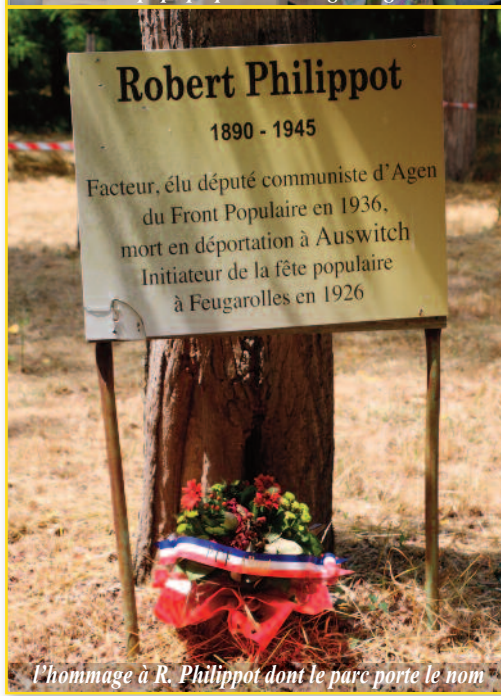
l'hommage à R. Philippot dont le parc porte le nom