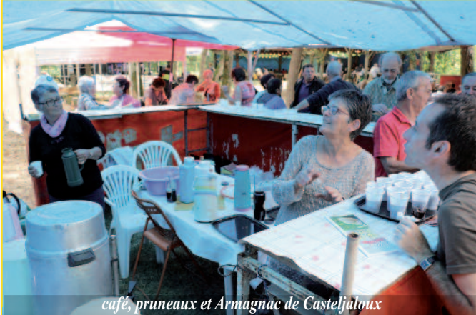
café, pruneaux et Armagnac de Casteljaloux