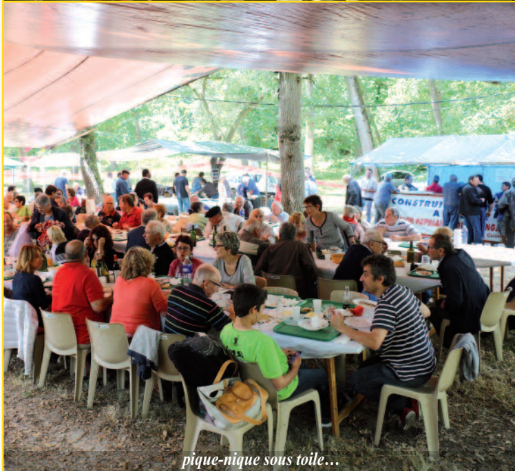
pique-nique sous toile...