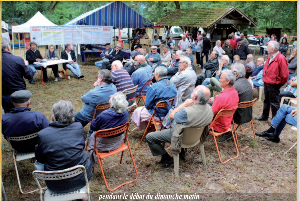
pendant le débat du dimanche matin