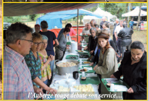
l'Auberge rouge débute son service...