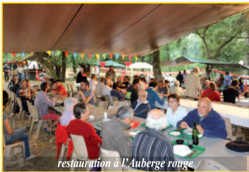
restauration à l'Auberge rouge