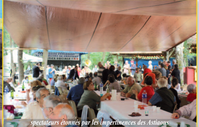
spectateurs étonnés par les impertinences des Astiaous