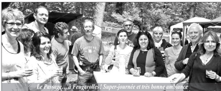
Le Passage... à Feugarolles! Super-journée et très bonne ambiance