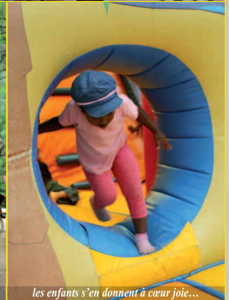
les enfants s'en donnent à cœur joie...