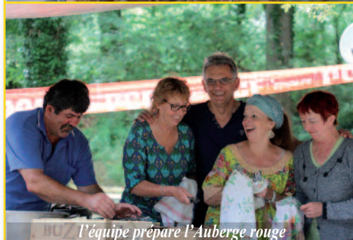
l'équipe prépare l'Auberge rouge