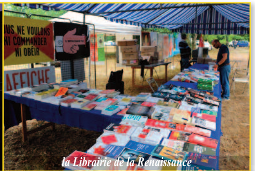
la Librairie de la Renaissance