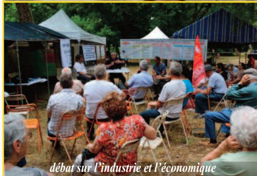
débat sur l'industrie et l'économique