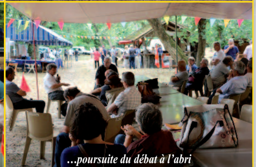
...poursuite du débat à l'abri