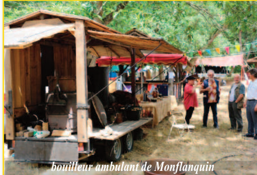
bouilleur ambulant de Monflanquin