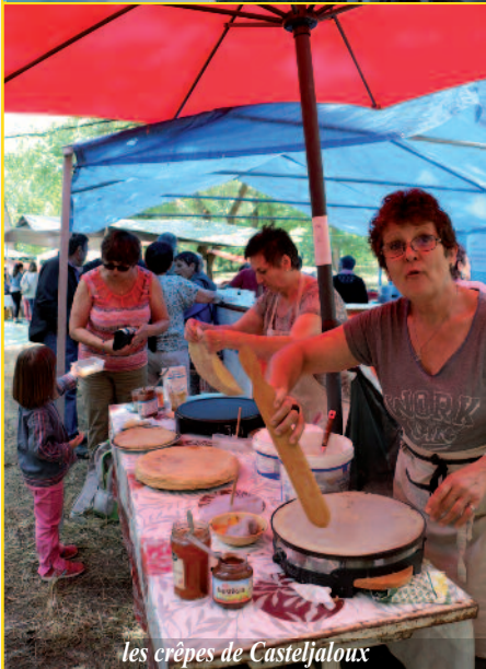
les crêpes de Casteljaloux