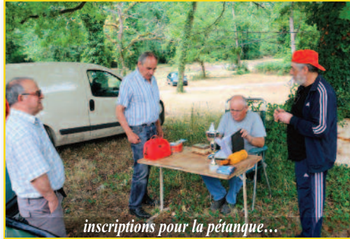
inscriptions pour la pétanque...

Bref ! une très belle équipe de militants rebelles et solidaires qui a permis la réussite de cette nouvelle fête et donné à voir que des forces existent et peuvent se rassembler pour faire reculer les inégalités dans le département. ■