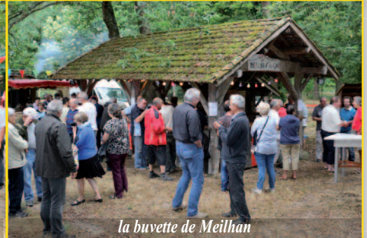
la buvette de Meilhan