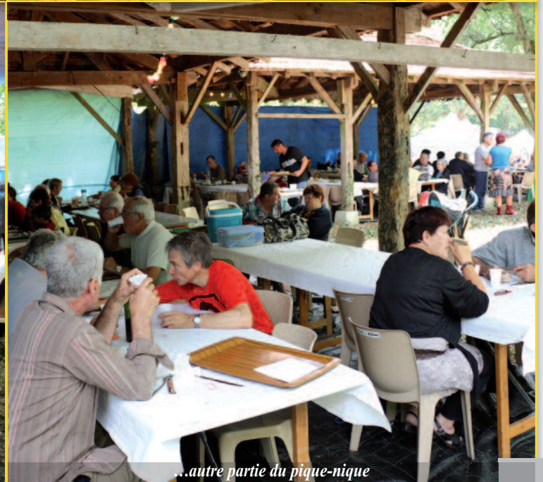
...autre partie du pique-nique