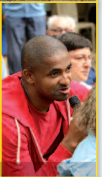
intervenants au débat