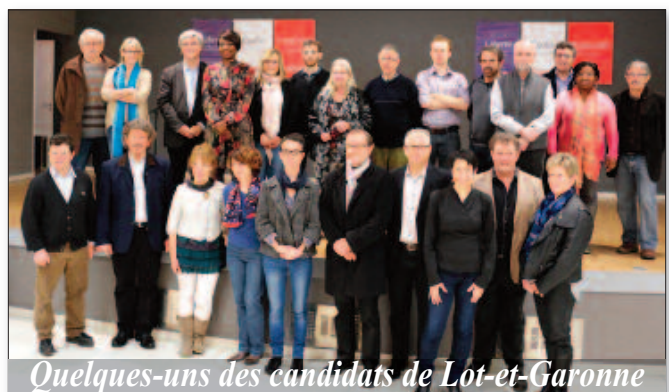
Quelques-uns des candidats de Lot-et-Garonne

Nul ne peut aujourd'hui mettre en cause l'action des Départements qui, depuis plus de trente ans, ont parfaitement rempli leurs missions. ■