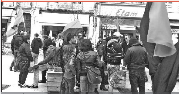
Manifestation antiraciste à Agen, le 29 mars dernier

La récente nomination de Manuel Valls laisse mal augurer d'un ressaisissement qui seul permettrait d'endiguer la montée du FN. Tant sur le plan économique que sur celui du hit-parade des expulsions de la politique sécuritaire ou encore de la stigmatisation des Roms, le nouveau Premier apparaît comme celui de la continuité d'une politique qui explique le récent séisme électoral. Il appartient au pouvoir en place d'apporter les réponses politiques, économiques et sociales qui redonneront confiance aux couches populaires et moyennes qui subissent le plus les inégalités sociales. ■